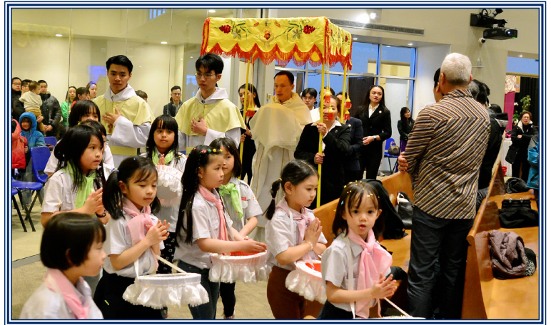
Kiểm Minh Thánh Chứa qua Nhà Tạm