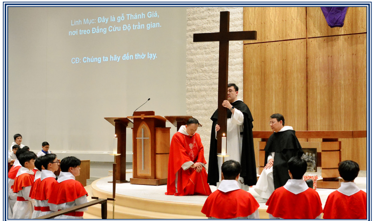
Nghi Thức Thứ 6 Tuần Thánh