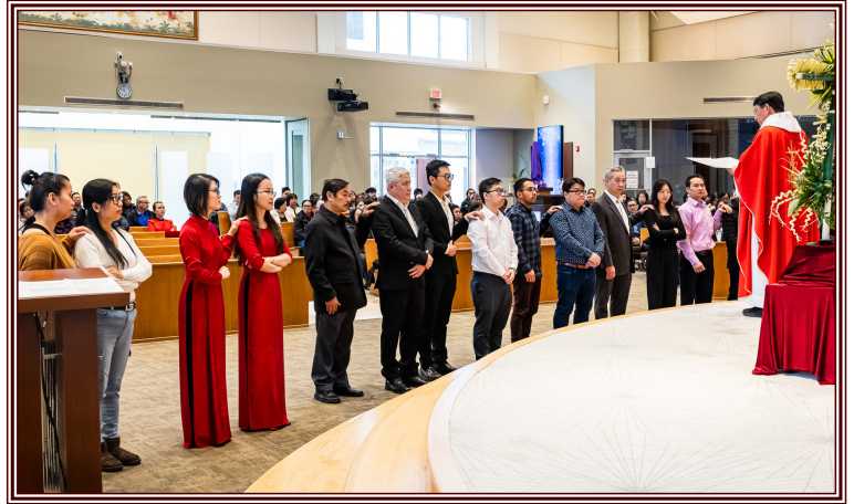
Các Anh Chị Em Dự Tông