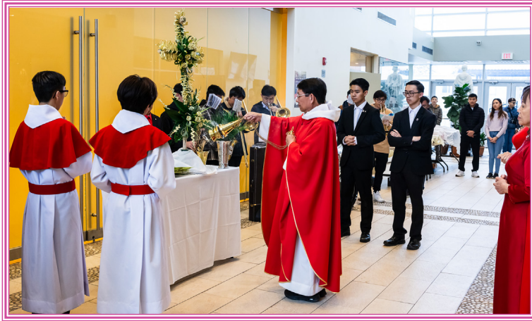
Chúa Nhật Lễ Lá