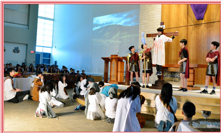
BGL diễn Sự Thương Khó Của Chúa Giê-su Ki-tô