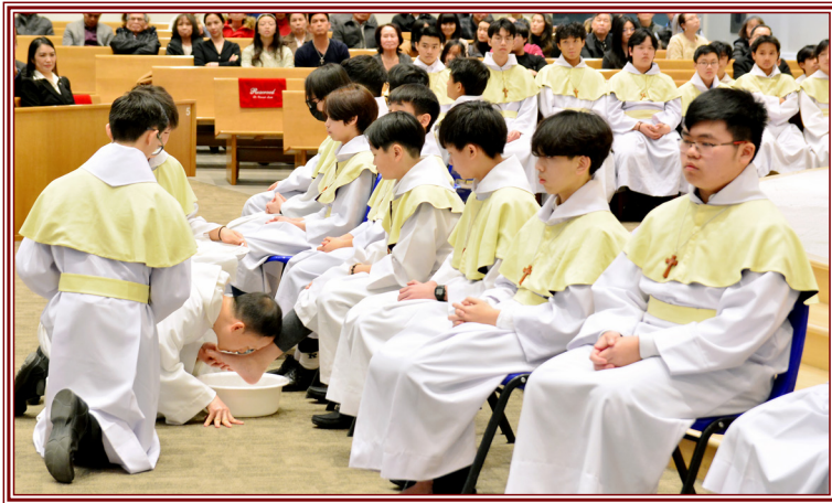
Nghi Thức Rửa Chân - Thứ 5 Tuần Thánh